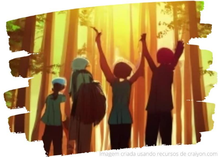
Imagem criada usando recursos de crayon.com